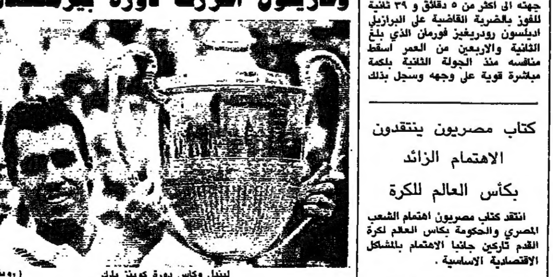
ليندل وكأس دورة كوينز بارك

احرز التشيكوسلوفاكي ايفان ليندل المصنف اولاً دورة كوينز كلوب الدولية في كرة المضرب بعد فوزه في المباراة النهائية على الألماني الغربي بوريس بيكر المصنف ثالثاً ٣/٦، ٦/٤ في دقيقة.